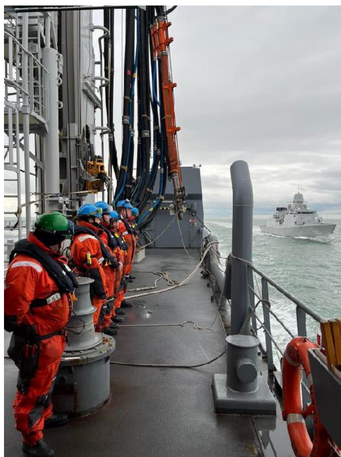
Zr. Ms. Karel Doorman na acht maanden onderhoud weer naar zee, in actie met bevoorraden op zee.

Op indicatie werden incidentele vakantie- en kerstgiften verstrekt voor een totaalbedrag van € 31.600.