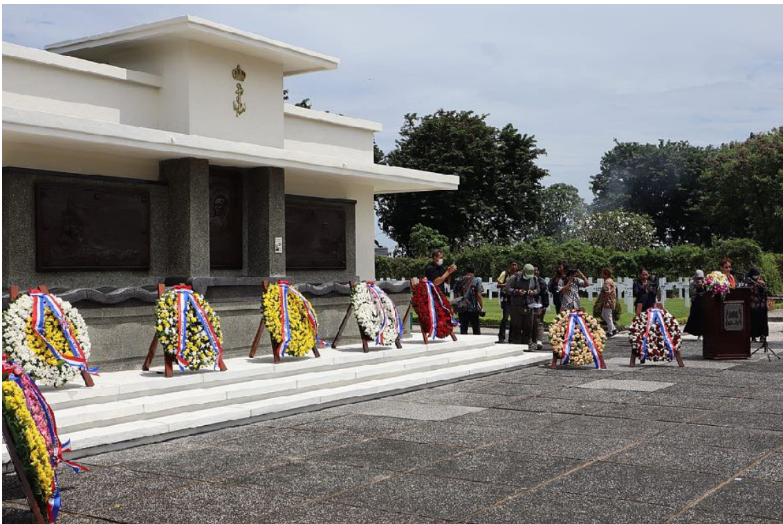
Herdenking Slag in de Javazee op 27 februari 2023 op ereveld Kembang Kuning te Surabaya

Ook werden er namens het KDF bloemen gelegd in Bronbeek en op het ereveld Kembang Kuning in Indonesië.