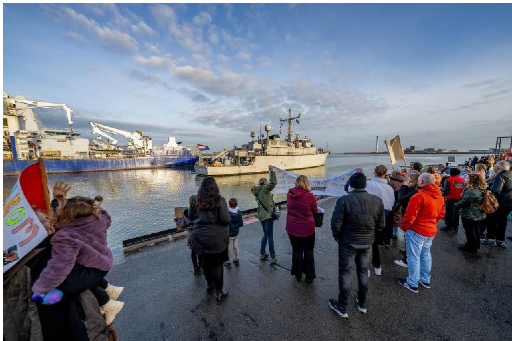
Zr. Ms. Vlaardingen weer thuis na vier maanden NAVO-inzet