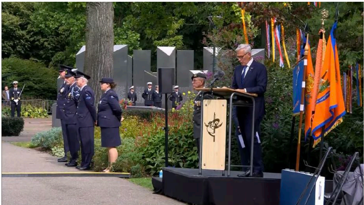
Toespraak van onze voorzitter bij de herdenking op 2 september 2023, bij het Nationaal Indië monument te Roermond.

Het KDF heeft voor de posten individuele steun en zorg geen taakstellende begroting. Voor de overige posten wordt uitgegaan van een verhouding doelrealisatie/overige kosten van 2:1 zijn. Die verhouding mag slechts ten gunste van de doelrealisatie wijzigen.