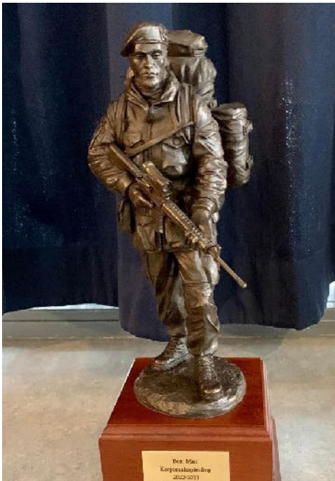
Hakkenberg trofee 2023