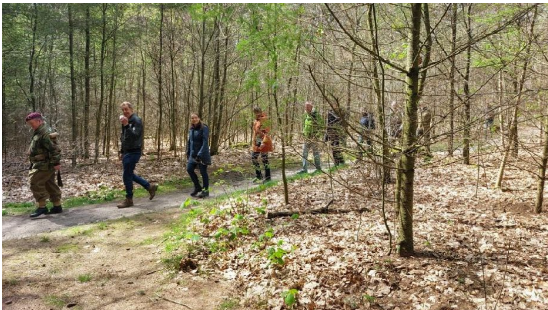
Het bestuur met partners op Battlefield tour in Ede (Operatie Pegasus)

Op zaterdag 29 april hebben de bestuursleden met partner een bezoek aan "de Smederij" in Ede gebracht en aldaar de "Battlefield tour Pegasus" gedaan.